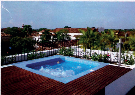
LA VISTA DESDE EL JACUZZI ES SENCILLAMENTE ESPECTACULAR.